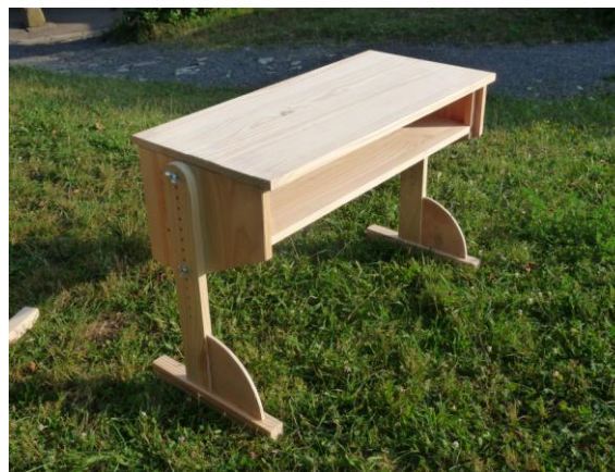
Réalisations séjour ados. Photos non contractuelles.

Capacité d'accueil : 42 enfants (20 pour le séjour ados)